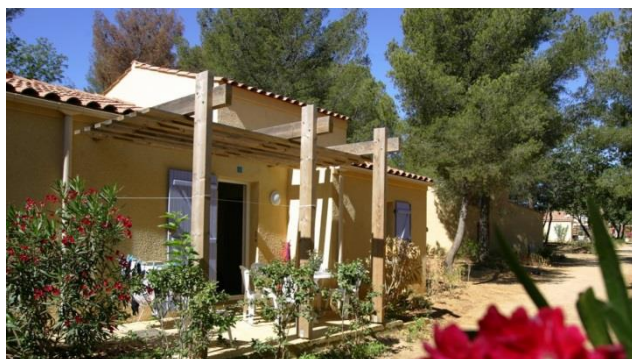
Une maisonnette de La Manne