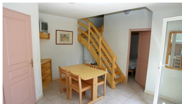
La salle de séjour d'une maisonnette