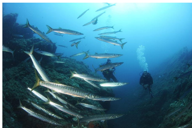
Banc de barracudas à la Gabinière