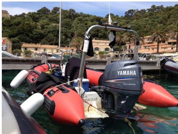
Notre semi-rigide Pitouille à Port Cros