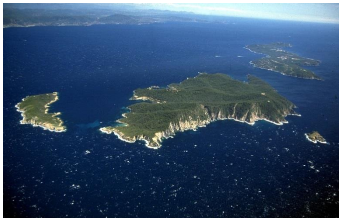
L'île de Port Cros, l'îlot de la Gabinière à droite

L'île de Port Cros, faisant partie des Iles d'Hyères, est située dans le Var face à Bormes les Mimosas et au Lavandou. L'île est classée Parc National dans sa totalité, ainsi que la zone maritime qui l'entoure. Du fait de son statut, c'est un site privilégié pour la plongée sous-marine. Notamment, la présence systématique de nombreux mérous bruns sur l'îlot de la Gabinière est caractéristique. Les épaves remarquables du Donator et du Grec sont à proximité.