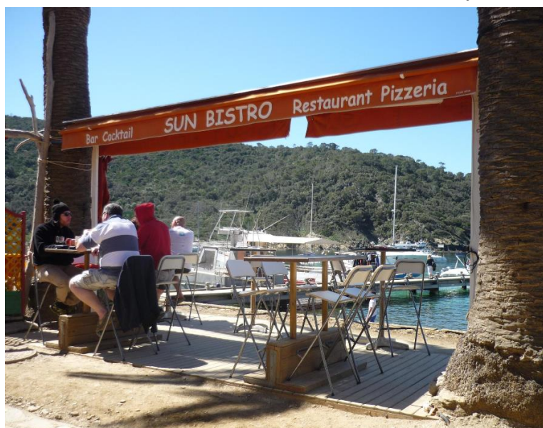
Le SUN BISTRO à Port Cros