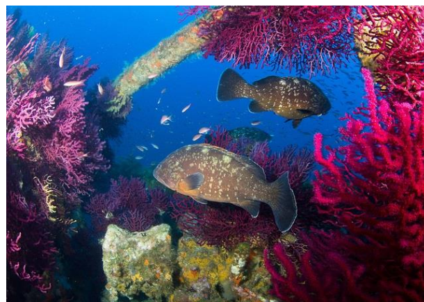
Les mérous de Port Cros