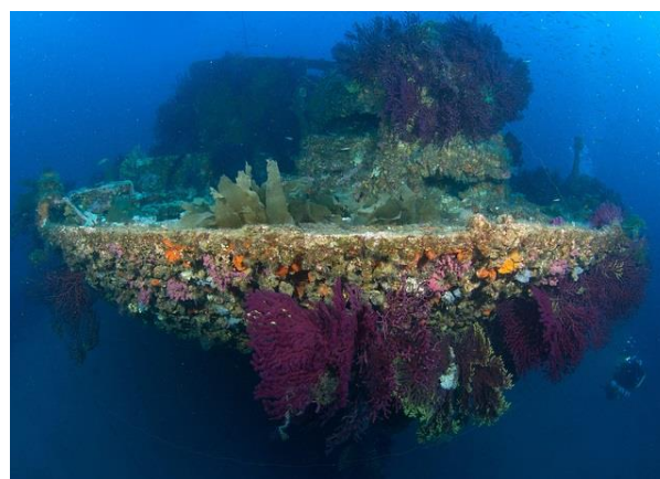
L'épave mythique du Donator