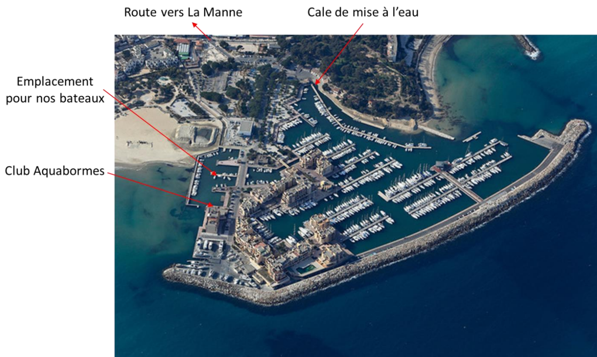
La Favière, port de Bormes les Mimosas